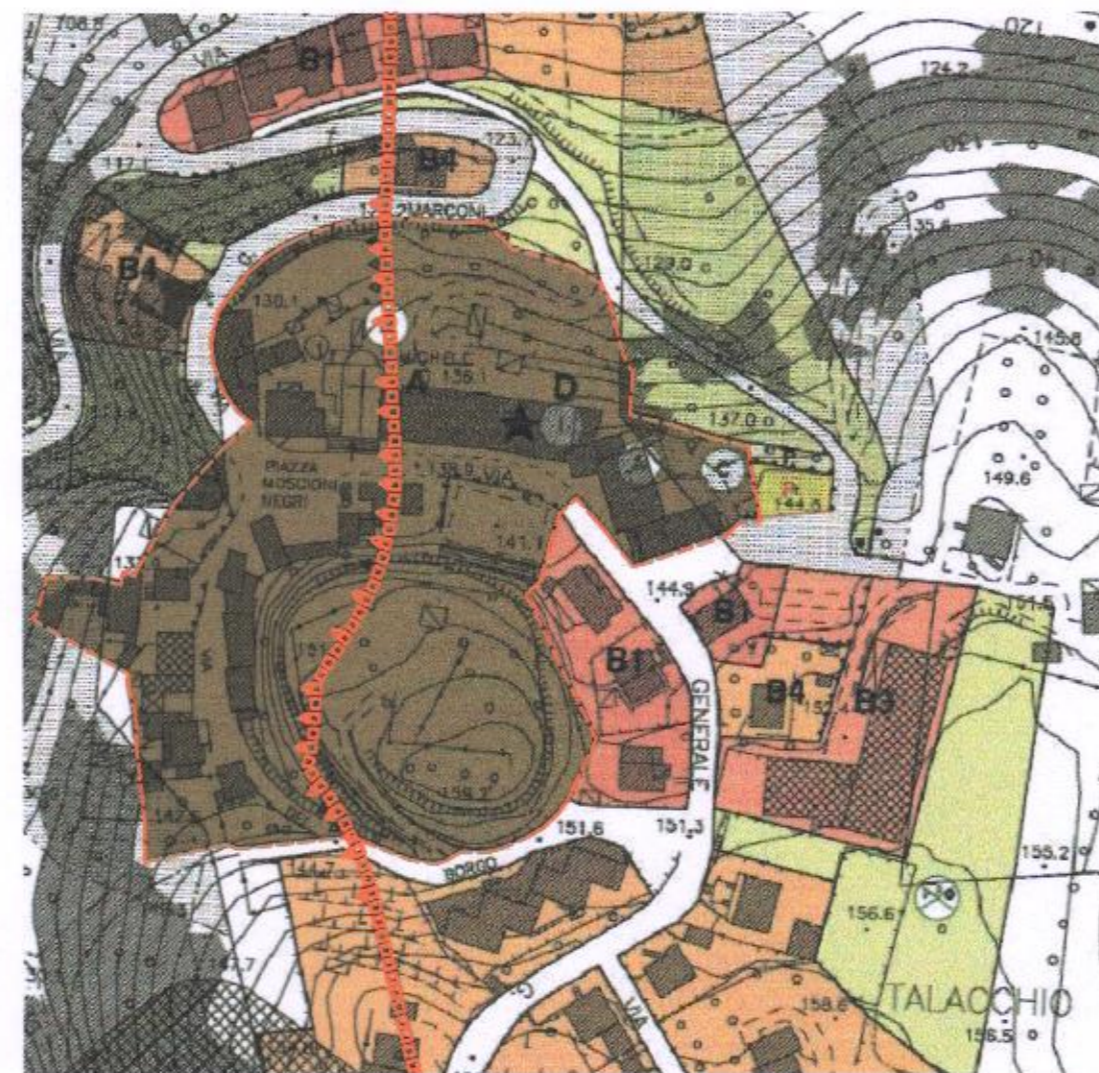
PLANIMETRIA P.R.G. VIGENTE

tel. 0721/22249-403653 ufficio tecnico@architestudio.com P. IVA 01078560412 61100 PESARO CENTRO DIREZIONALE BENELLI via Mameli, 72 sc. C int. 110