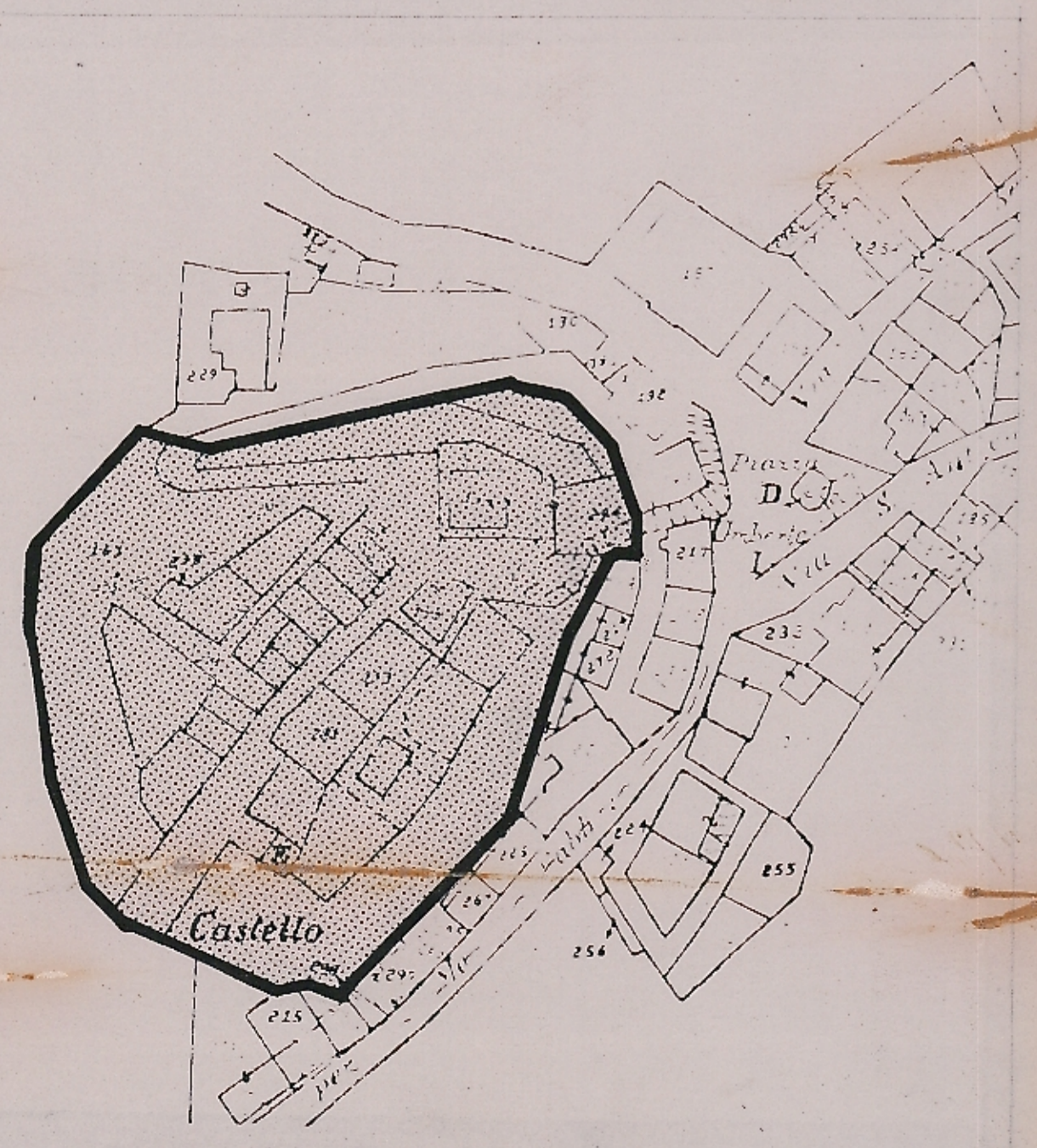
PLANIMETRIA CATASTALE SC 1:1000

— PERIMETRAZIONE DELL'AREA OGGETTO DEL PIANO PARTICOLAREGGIATO ▨ AREA OGGETTO PIANO PARTICOLAREGGIATO