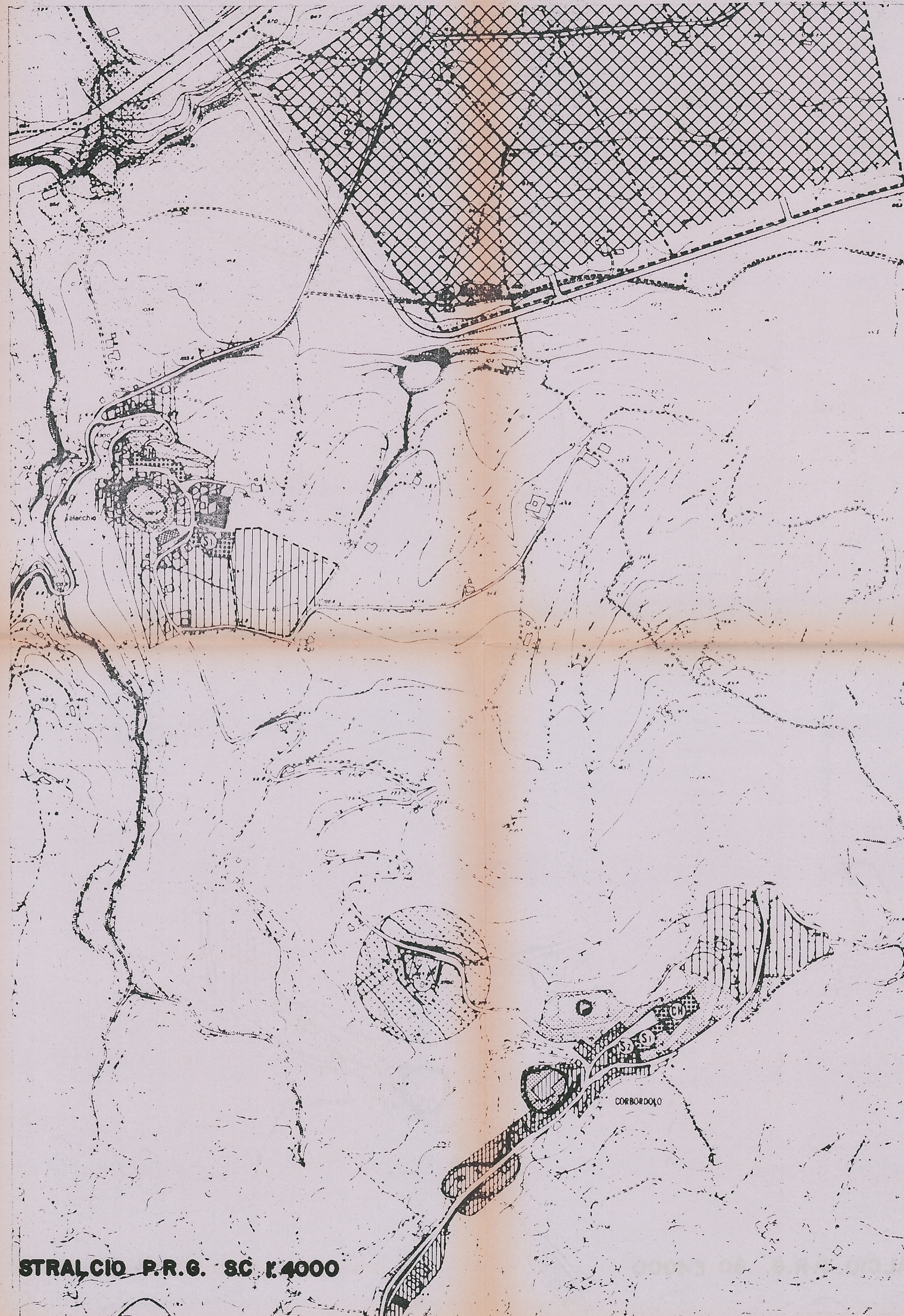
STRALCIO P.R.G. SC 1:4000