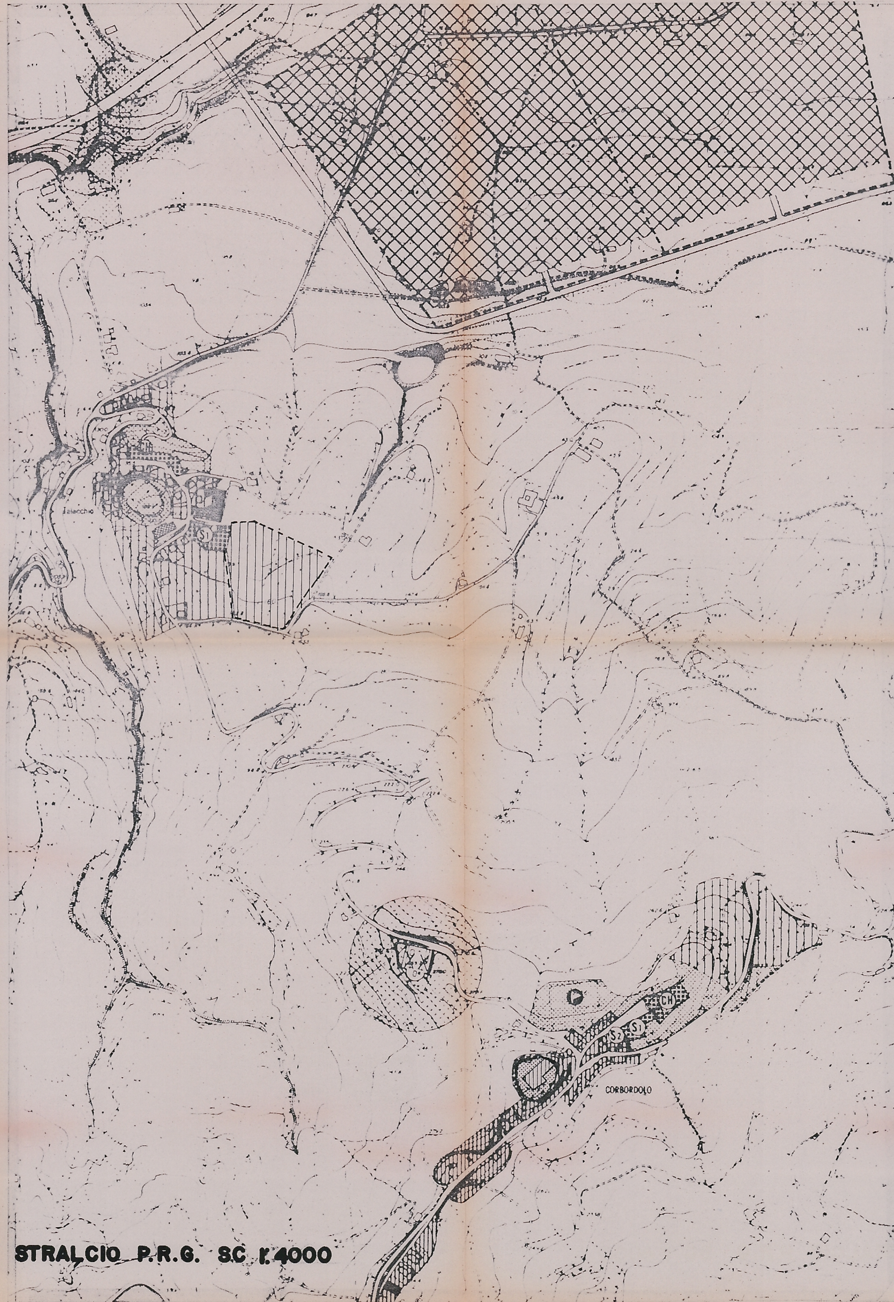
STRALCIO P.R.G. SC 1:4000