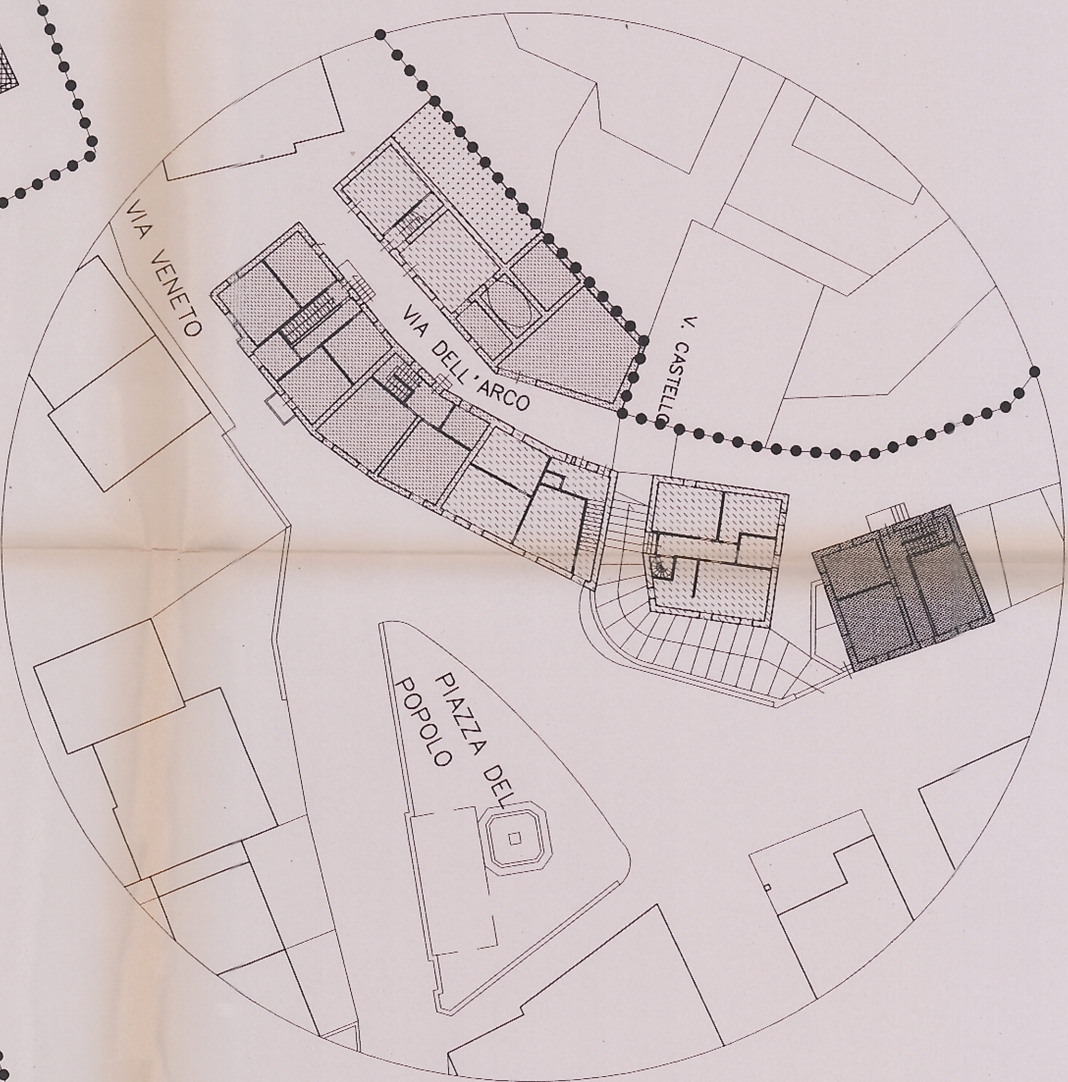
PARTICOLARE sc. 1:250 ACCESSI DALLA VIA DELL'ARCO