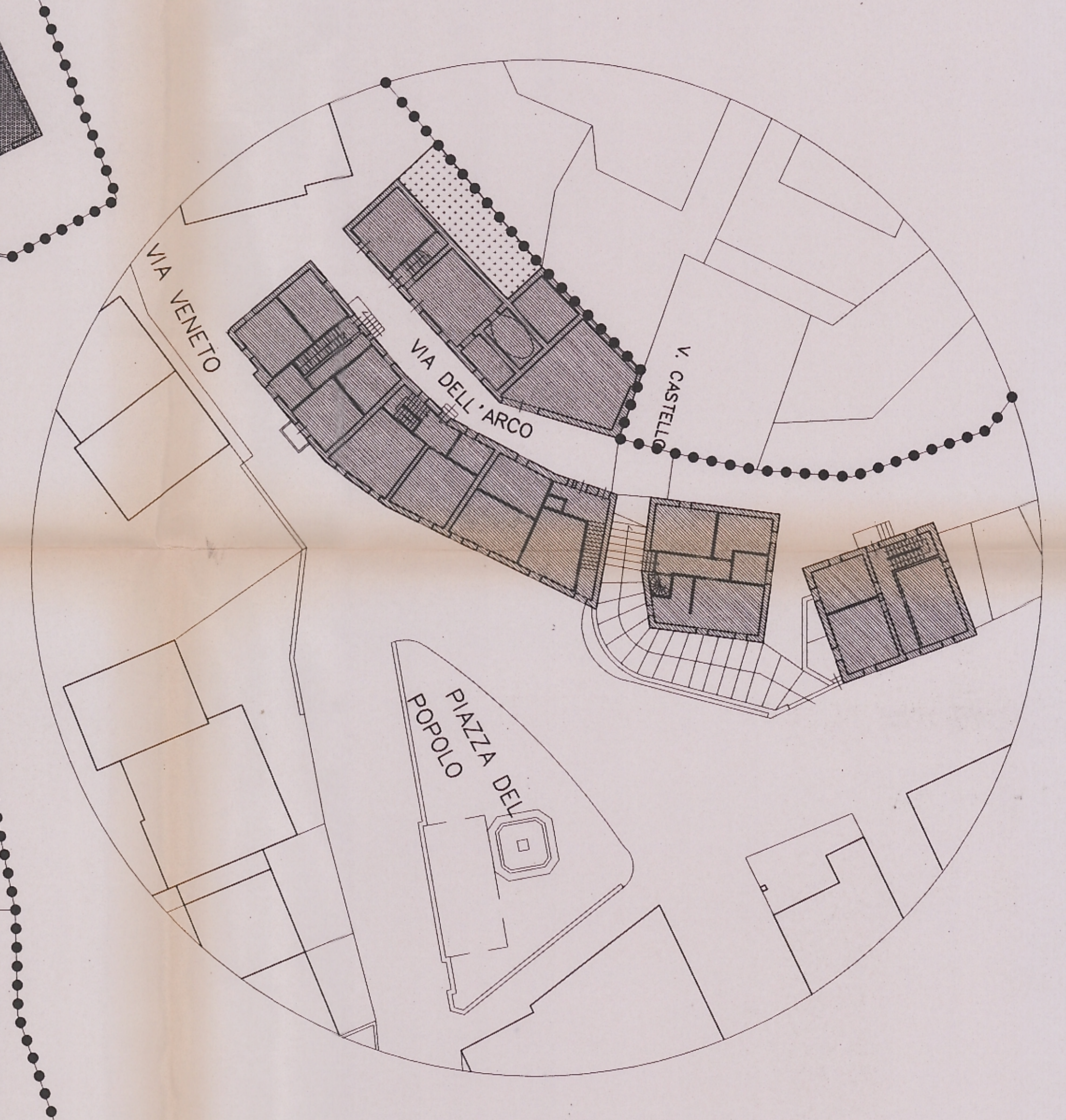
PATTOLORE sc. 1:250 ACCESSI DALLA VIA DELL'ARCO