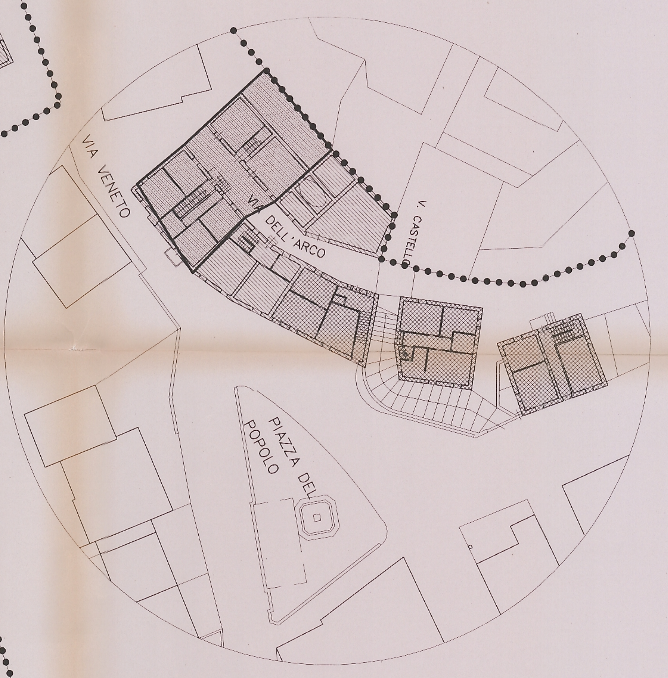
PATICOLARE sc. 1:250 ACCESSI DALLA VIA DELL'ARCO