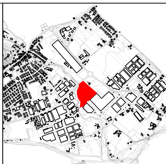
INQUADRAMENTO TERRITORIALE scala 1:20 000